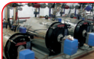
Hornos - Calderas